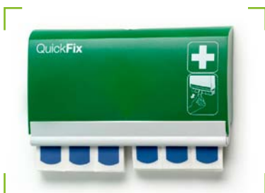
QuickFix Pflasterspender Detectable inkl. 2 x 45 Pflaster