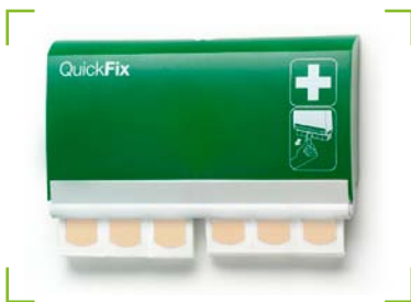
QuickFix Pflasterspender Elastic inkl. 2 x 45 Pflaster