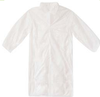
PE-Besuchermäntel mit 4 Druckknöpfen und Hemdkragen Länge: ca. 115 cm einzeln im Beutel verpackt