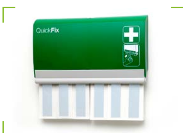
QuickFix Pflasterspender Detectable long inkl. 2 x 30 Pflaster