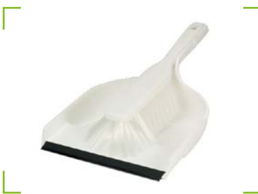
Hygiene - Kehrgarnitur weiß Schaufel mit tiefer Schmutzwanne