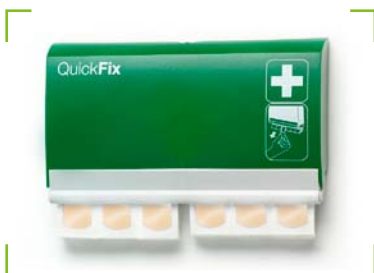
QuickFix Pflasterspender Water Resistant inkl. 2 x 45 Pflaster