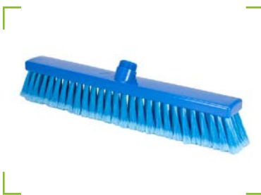
Hygiene - Besen blau Besatz blau geschlitzt