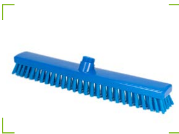
Hygiene - Schrubber blau harte blaue Borste