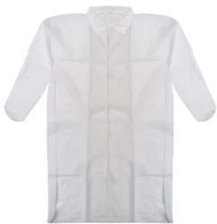
PP-Vlies Besuchermäntel mit Klettverschluss und Hemdkragen einzeln im Beutel verpackt