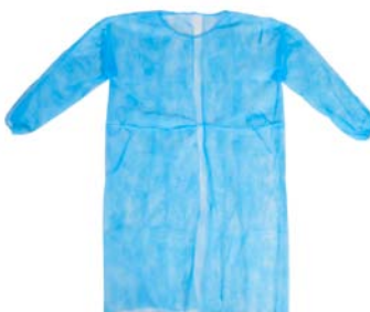
PP-Vlies Besucherkittel zum Binden, latexfrei mit elastischen Bündchen 10 Stück im Beutel Größe: 115 x 137 cm