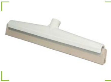
Hygiene - Wasserschieber weiß/weißes Gummi 40 cm