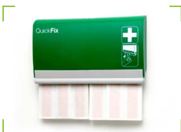
QuickFix Pflasterspender Elastic long inkl. 2 x 30 Pflaster