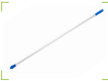
Hygiene - Glasfaserstiel blauer Griff